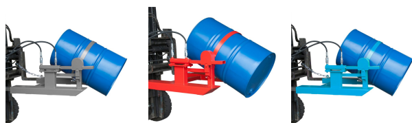
Wymiary wewnętrznego rozstawu widel