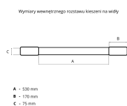
Wymiary wewnętrznej części beczki na widły