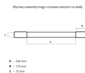
Wymiary wewnętrznej rozstawki kłaczki na widły