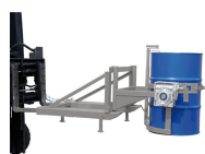
Wymiary wewnętrznej rozstawu kołozur na widły