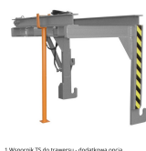
1. Wzornik TS do trawersu - dodatkowa opcja.