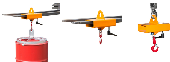
Wymiary kieszeni na widły