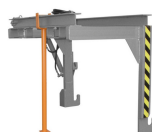
1. Wyporna T5 do trawersu - dodatkowa opcja.