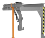
1. Wyporna T5 do trawersu - dodatkowa opcja.