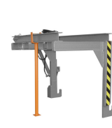
1. Podpora do trawersu typu T3 - dodatkowa opcja