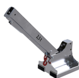
Wymiary kieszeni najszerszych (mm)