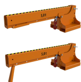
Ułożenie ramienia w zależności od pozycji wysunięcia haka