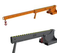
Wymiary kieszeni najszerszych (mm)