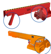
Wymiary klipszeń najjedźnych (mm)