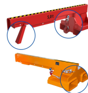
Wymiary klipszeń najszerszych (mm)