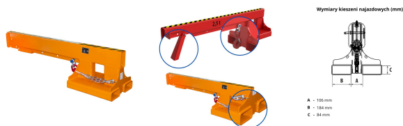
UŻYTO RAMIENIA W ZALEŻNOŚCI OD POZycji WYŚNIECIA HAKA