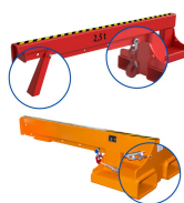
Wymiary kieszeni najeżdżowych (mm)