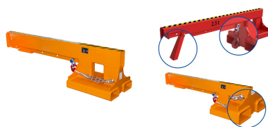
Wymiary kieszeni najeżdżowych (mm)