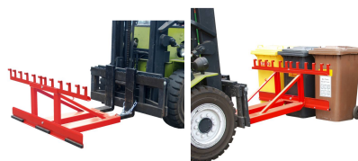
Podnośnik do pojemników na odpady MH3 - wymiary wewnętrznego rozstawu widel