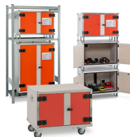
Możliwości poszczególnych modeli szaf LOCKEX