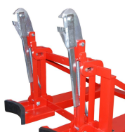
Chwytnak do beczek o różnych rozmiarach do wózka widłowego podwójny RS-II/M - wymiary wewnętrznej rozstawu widelc