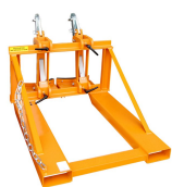
Chwytnak do beczek o różnych pojemnościach do wózka widłowego podwójny RS-II/D91 - wymiary wewnętrznej ramy wódek